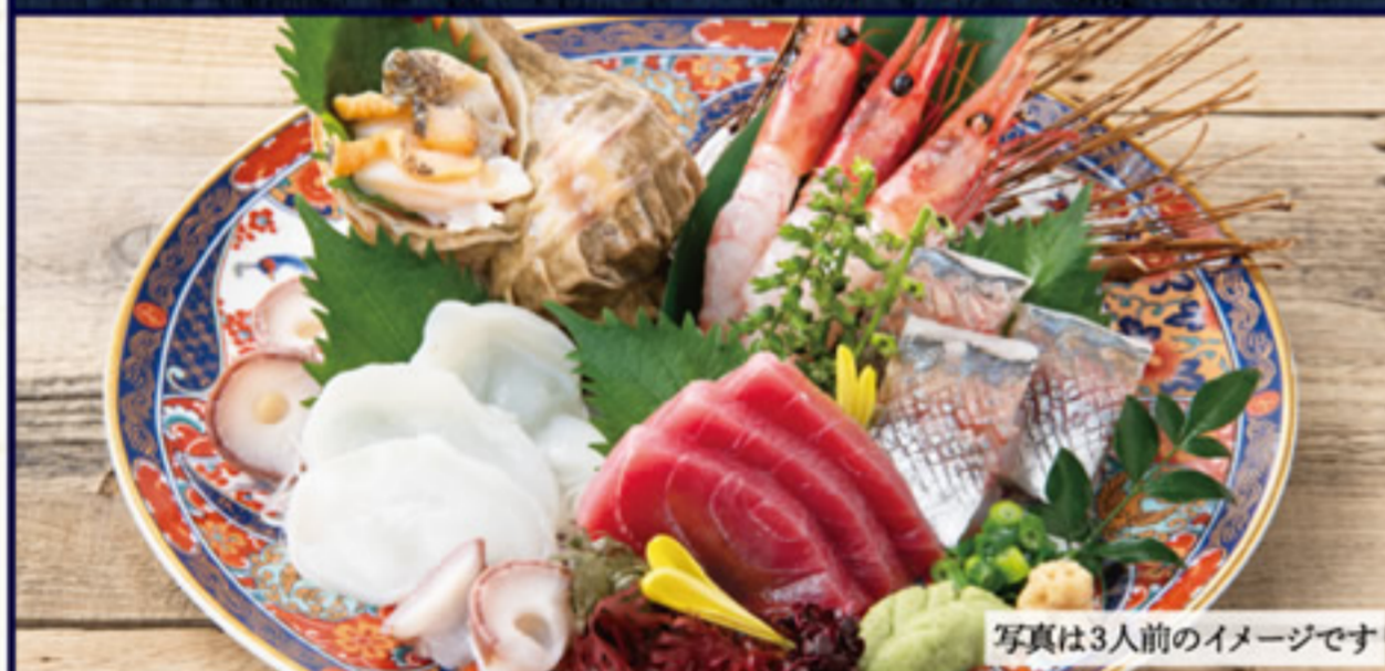
写真は3人前のイメージです