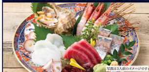
写真は3人前のイメージです