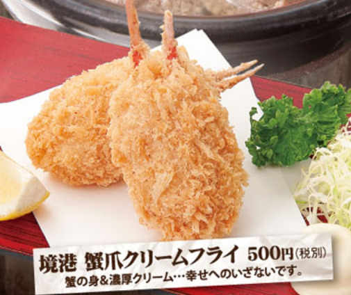
境港 蟹爪クリームフライ 500円(税別) 蟹の身&濃厚クリーム…幸せへのいざないです。