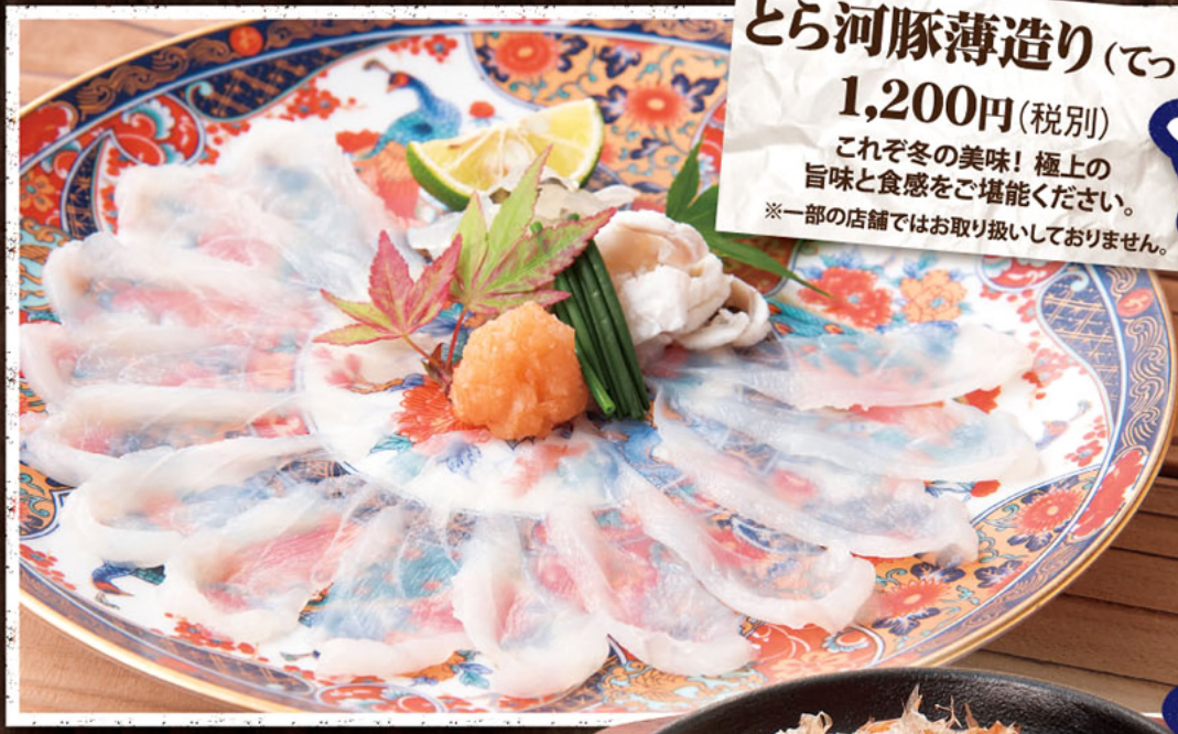
とら河豚薄造り (てっさ) 1,200円(税別) これぞ冬の美味! 極上の旨味と食感をご堪能ください。 ※一部の店舗ではお取り扱いしておりません。