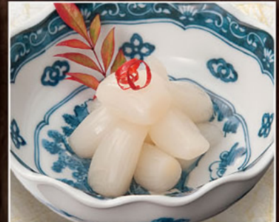
砂丘らつきよう 380円(税別) 鳥取が誇る味な名産役!