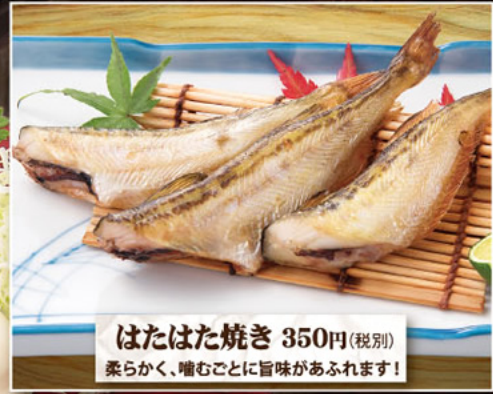
はたはた焼き 350円(税別) 柔らかく、噛むごとに旨味があふれます!